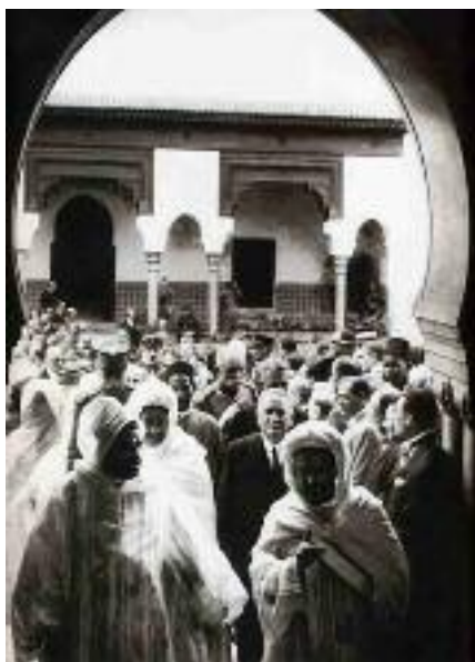
Inauguration de la mosquée de Paris, en 1926

au barbouillage infernal. Que leurs consciences soient couleur de robe ou couleur de peau, leurs costumes restent enviables ; le plus négligent des hommes serait capable des frais de toilette qui aboutiraient à ces magnifiques « cappa magna », à ces manteaux brodés de lune et de soleil. Notre Garde républicaine elle-même, si bien casquée, guêtrée et culottée soit-elle, cède, il me semble, à la splendeur diaprée de nos hôtes orientaux. Toute cette couleur dûment reconnue, il n'est pas moins vrai que nous sommes probablement en train de faire une grosse sottise. Cette mosquée en plein Paris ne me dit rien