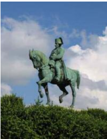
Statue de Napoléon à Laffrey