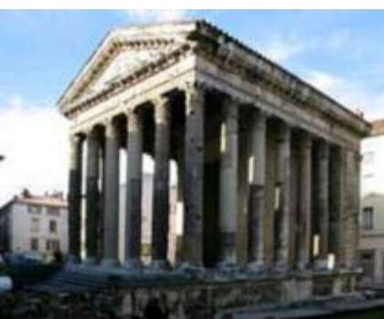
Vienne, Roman, Temple d'Auguste