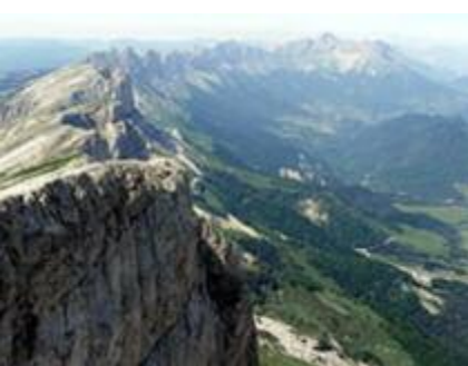
Massif du Vercors