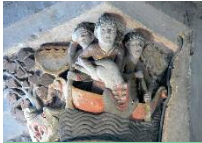
Jonas avalé par la baleine Chapiteau du XII e s. à Moissac

Les poissons se caractérisent par leur mutisme. Qui ne connaît l'expression « muet comme une carpe » ? Or, à leur manière, ils peuvent devenir éloquentes. Un jour, à Rimini, saint Antoine de Padoue parlait à la foule. Mais nul n'écoutait. Les hommes parlaient affaires, les commères jasaient, les jeunes ricanaient. Fatigué, saint Antoine quitta cet auditoire distrait. Puisque les humains ne voulaient rien entendre, les poissons, eux, seraient plus attentifs. Et le prédicateur, suivant le bord de l'eau, s'en alla à la rencontre des poissons. Ceux-ci, remontant le cours d'eau, affluèrent en foule, petits et gros, écarquillant leurs yeux ronds. À la nouvelle du prodige, les habitants de Rimini accoururent, rougissant de honte. Ils devinrent tout yeux, tout oreilles. Ils demandèrent au saint de prêcher devant eux et firent silence. Ainsi, la ville de Rimini fut sanctifiée grâce aux poissons.