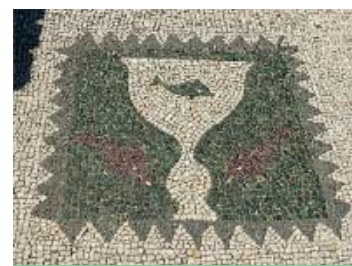
La Maison au Poisson, à Ostie port de Rome.