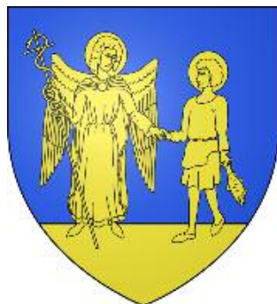
Bazon de Saint-Raphaël (var) l'archange Saint-Raphaël et Tobie

Le poisson est l'instrument du châtement divin dans LE LIVRE DE JONAS. Dieu a ordonné à Jonas de se rendre à Ninive pour convertir les païens. Or, Jonas désobéit et s'embarque sur un bateau phénicien. Une tempête furieuse l'oblige à avouer son péché aux marins. Il est jeté à la mer. « Et le Seigneur prépara un grand poisson afin qu'il en-